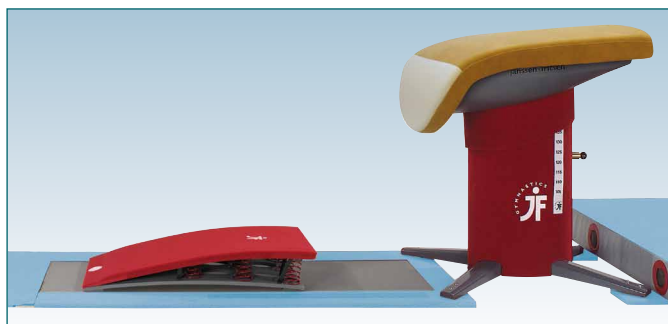
Piste d'élan : réf. I407135