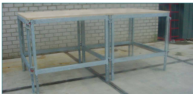
2 elementen met één houten plaat