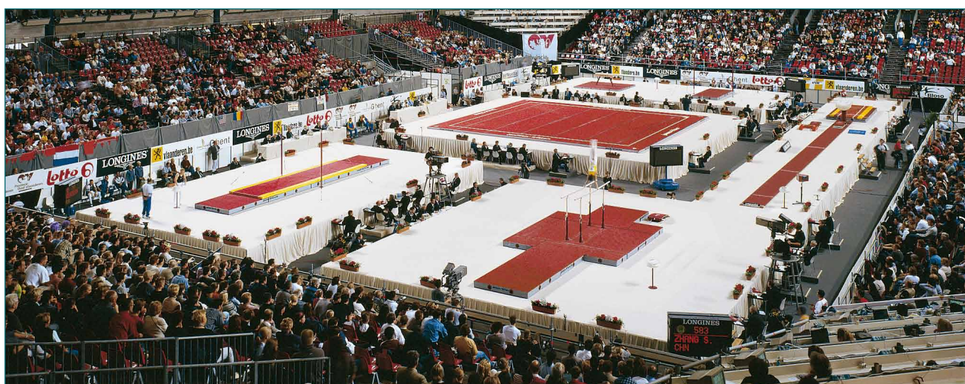
podium in FIG-opstelling op het Wereldkampioenschap in Gent

Dit hoogkwalitatieve Janssen-Fritsen product is FIG-gecertificeerd en wordt alom geprezen om zijn stabiliteit. Het podium werd gebruikt op de Olympische Spelen in Athene, op diverse Wereldkampioenschappen en heel wat regionale en nationale wedstrijden. Het is een modulair podium dat kan worden opgebouwd volgens de FIG-regels of aangepast aan uw plaatselijke behoeften of beschikbare ruimte. Dynamische stabiliteit is essentieel voor een gymnastiekpodium aangezien ongewenste of onvoorspelbare bewegingen of trillingen van het podium de eigenschappen van de toestellen sterk kunnen beïnvloeden. Het Janssen-Fritsen podium heeft bewezen dat het perfect geschikt is voor gymnastiekwedstrijden wereldwijd.