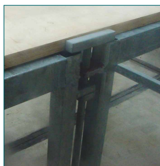
verbinding van elementen