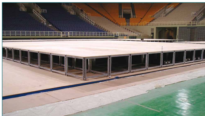
stalen frames en houten platen