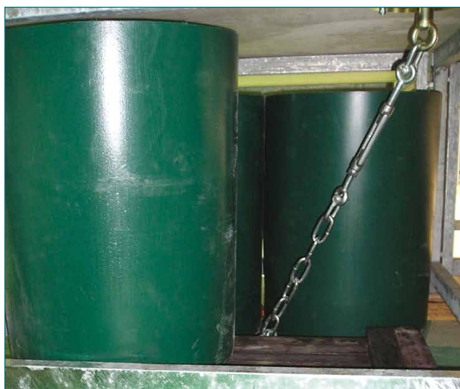
tegen gewichten onder het podium