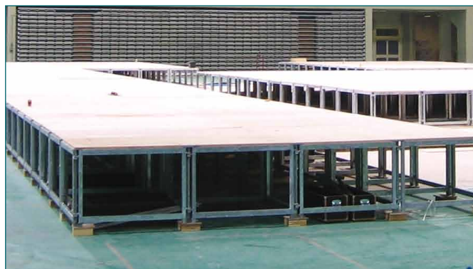
zijzicht voltooid podium