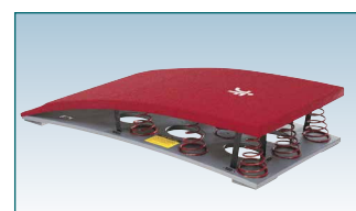
springplank 'Kreon'®: code I411640